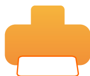
Impresora color inyección de tinta