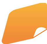
Papel transfer colores oscuros