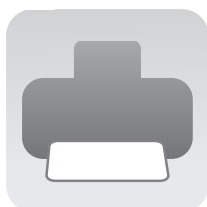
Imprime el diseño