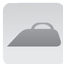
Plancha sobre el papel transfer y la camiseta (sigue las instrucciones del transfer)